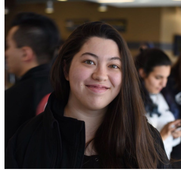
Bian M1 Agriculture/Ecology