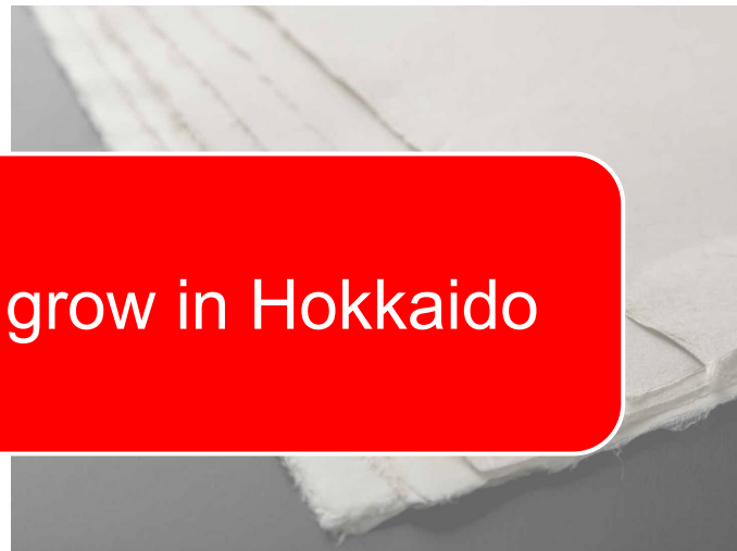
楮 Kozo Tree ( Broussonetia kazinoki )