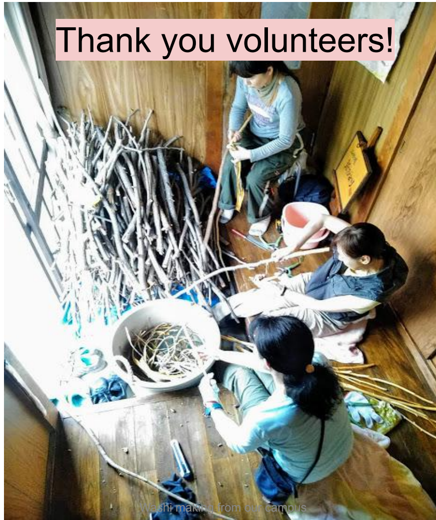
Washi making from our campus