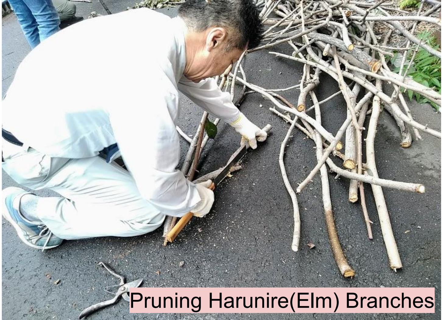
Pruning Harunire(Elm) Branches