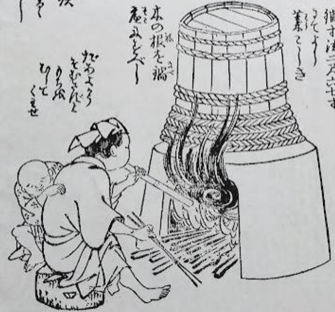
Traditional Wahi making