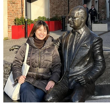
Maia B4 Law/European Politics