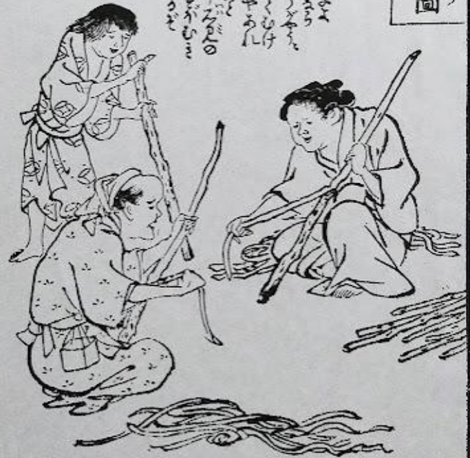
Traditional Wahi making