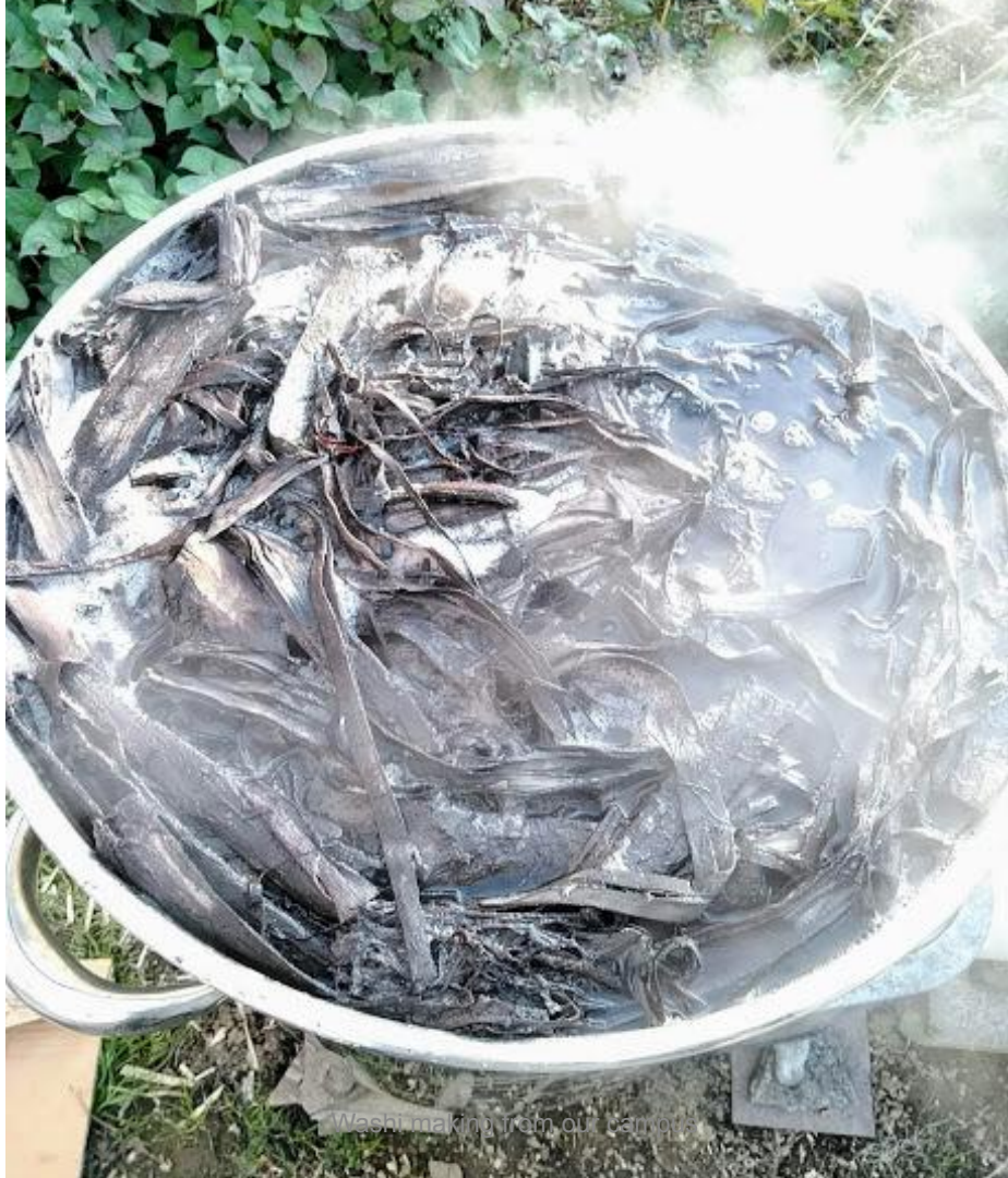
Washi making from our family