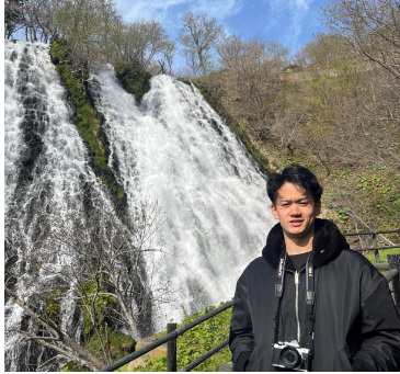
Taito B4 Agriculture/Ecology