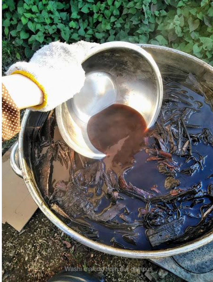
Washi making from our campus