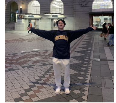
Kosuke B3 Law